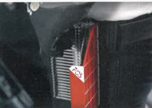
Das „Clipholster“ für magazinierte Sturmklammern wird am Gürtel getragen und hält die Sturmklammern so stets griffbereit

Das Online-Programm „FOS Windcheck“ für die Windsogberechnung ermöglicht die Auswahl des passenden Klammertyps und liefert Informationen zur Verlegung, Bereichseinteilung und benötigten Stückzahl