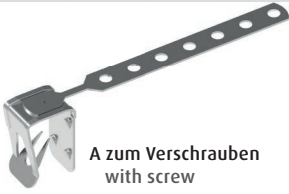
A zum Verschrauben with screw