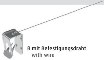
B mit Befestigungsdraht with wire