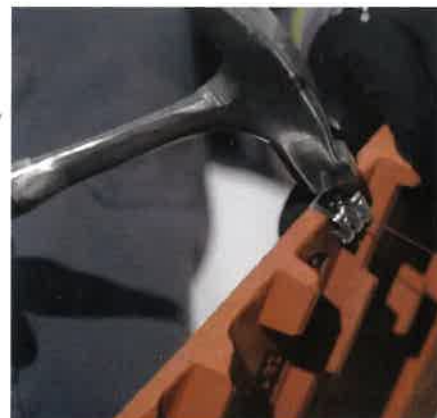
3. und aufgeschlagen.