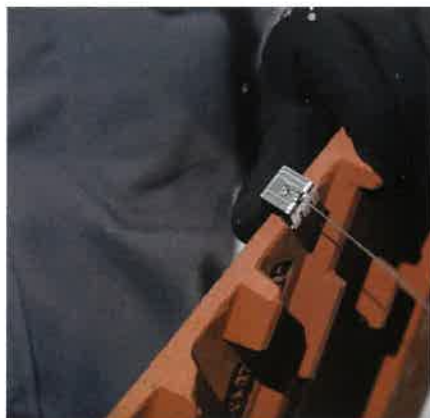
2. Die 513 wird auf die Schnittkante gesetzt ...