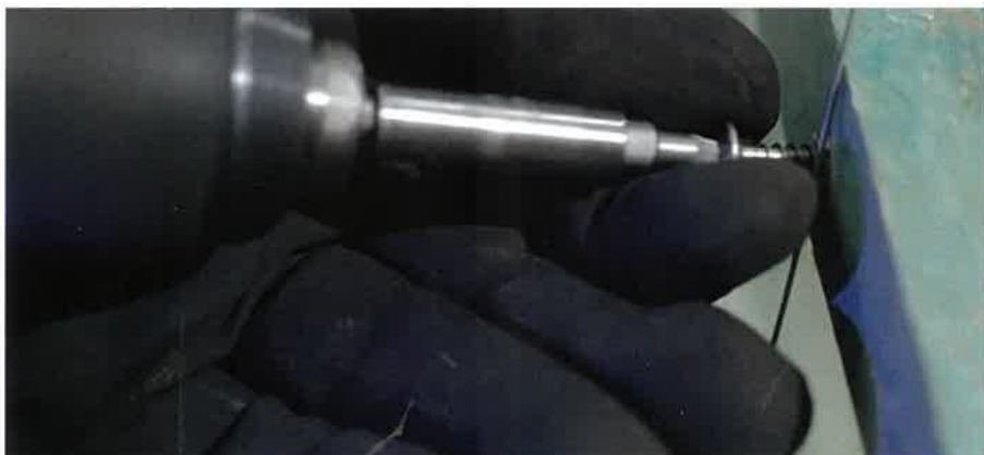
4. Eine korrosionsschutzte Schraube wird nahe der Pfanne an der Dachkonstruktion angebracht, aber nicht komplett eingeschraubt.