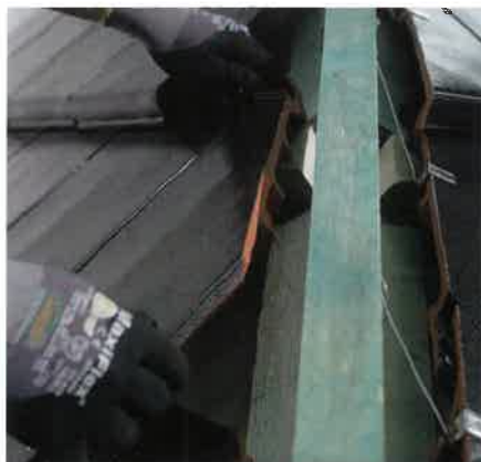
1. Die Pfanne wird zugeschnitten.

GmbH + Co KG (FOS) mit der Grat- und Kehlklemmer 513 an. Die sichere Befestigung, sowohl von Grat- und Kehlpfannen als auch von Ein- und Ausspitzern, erfolgt mit der 513 in wenigen einfachen Schritten: